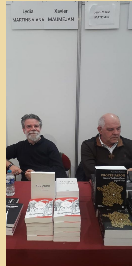
En séance de dédicaces