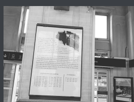
Chalon-sur-Saône, en gare