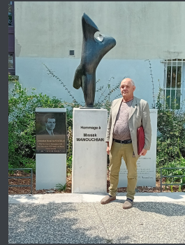
Valence, devant le monument à Missak Manouchian