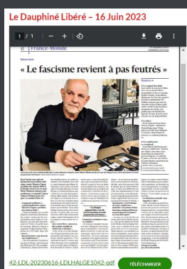
Le Dauphiné Libéré du 16 Juin