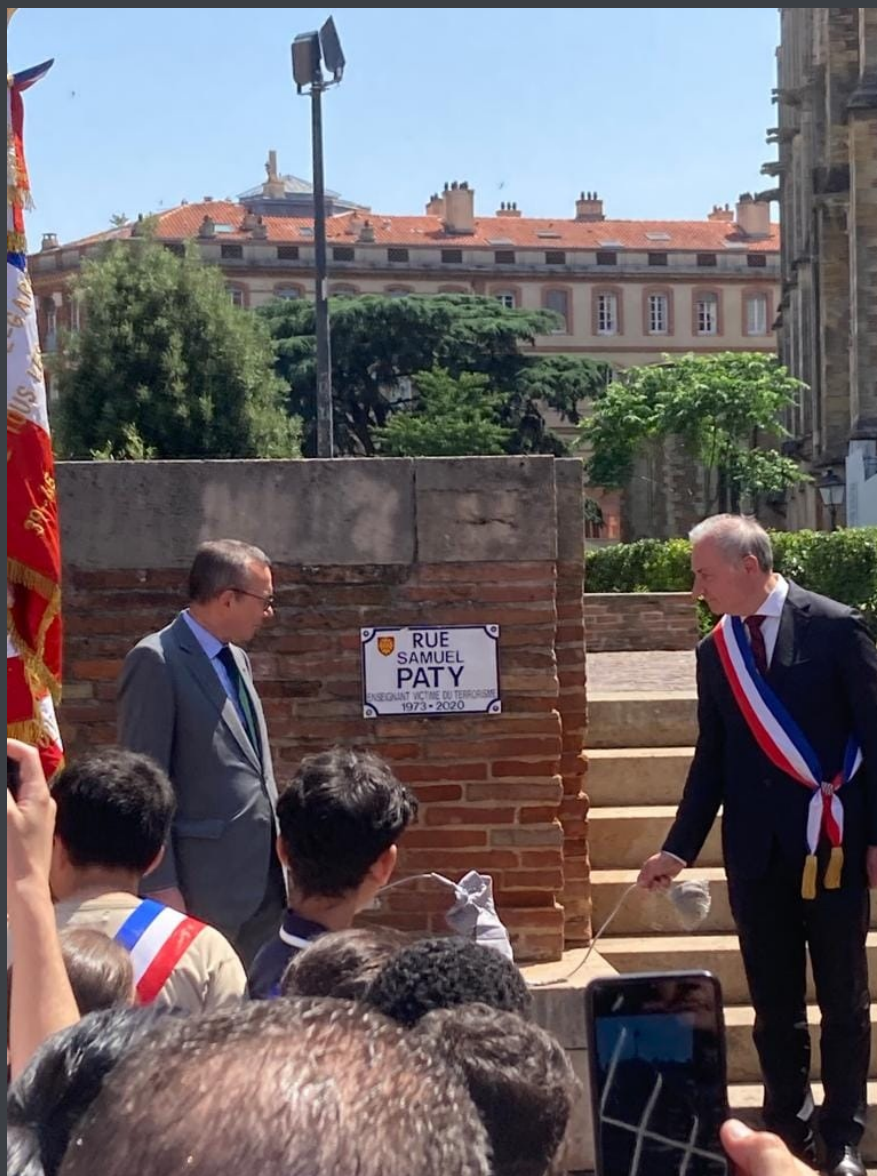
Fronton, le futur Parvis Samuel